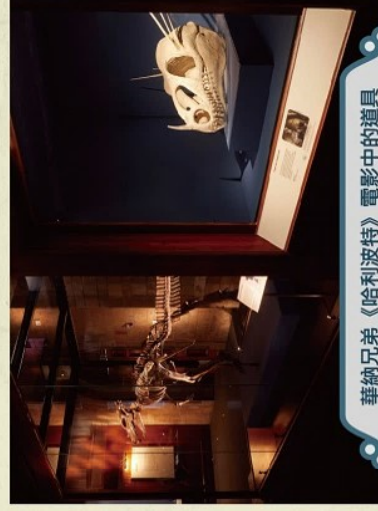
華納兄弟《哈利波特》電影中的道具 與現實世界中的文物並陳展示