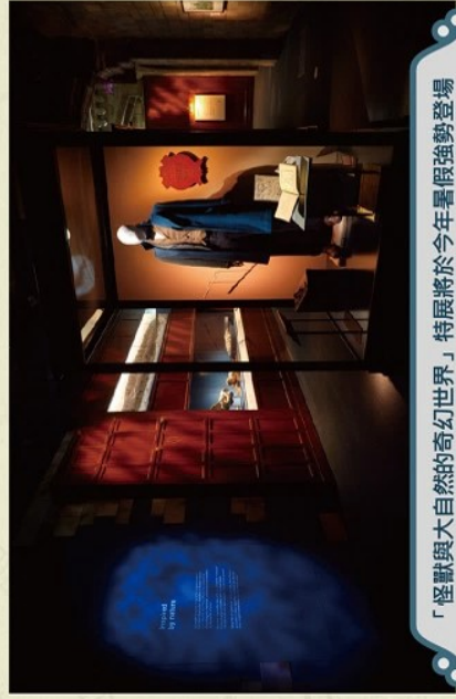
「怪獸與大自然的奇幻世界」特展將於今年暑假強勢登場 英國展出內容完整移師來台，不容錯過。